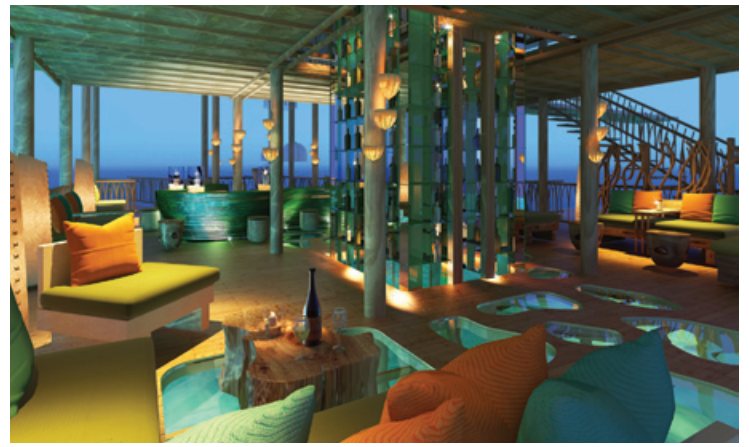
Chill Lounge & Bar