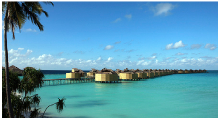
Six Senses Laamu

Курорт Six Senses Laamu расположен на атолле Лааму, находящемся в южной части Мальдивского архипелага. Путь от международного аэропорта Мале занимает всего пятьдесят минут на самолете до острова Кадду и двадцать пять минут на катере до белоснежных берегов Six Senses Laamu, окаймленных кристально чистой бирюзой океана.