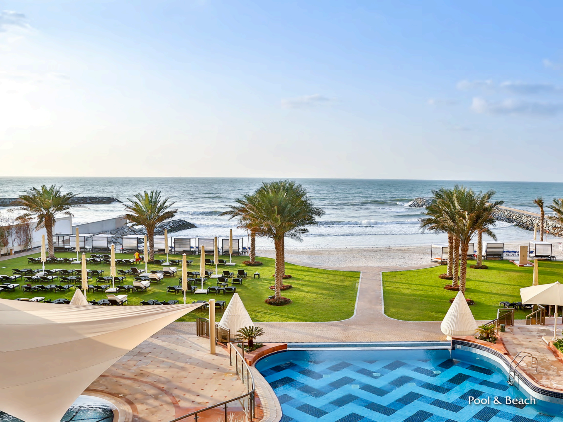
Pool & Beach