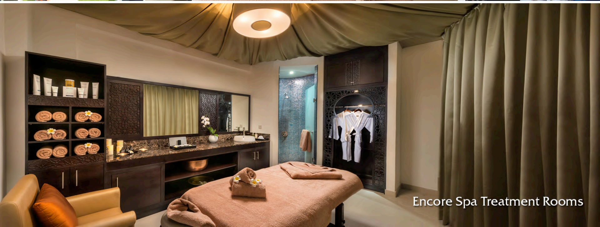
Encore Spa Treatment Rooms