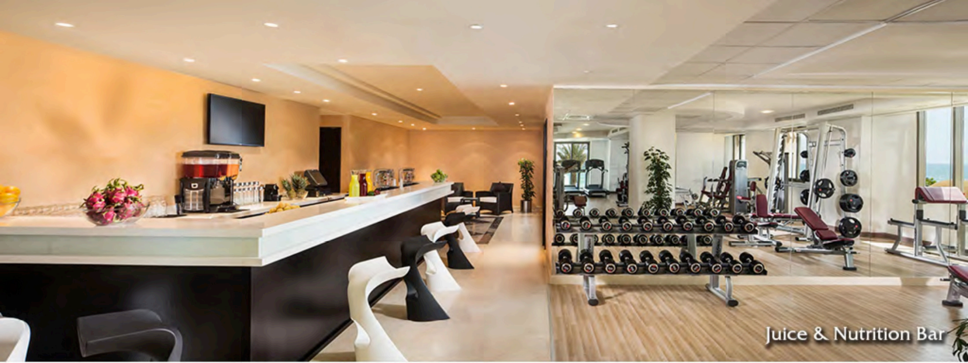
Juice & Nutrition Bar