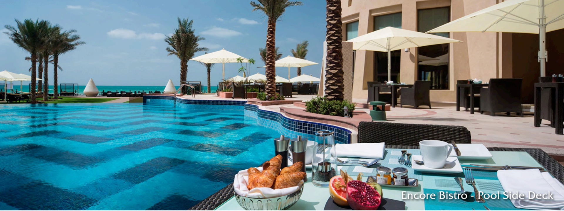
Encore Bistro - Pool Side Deck