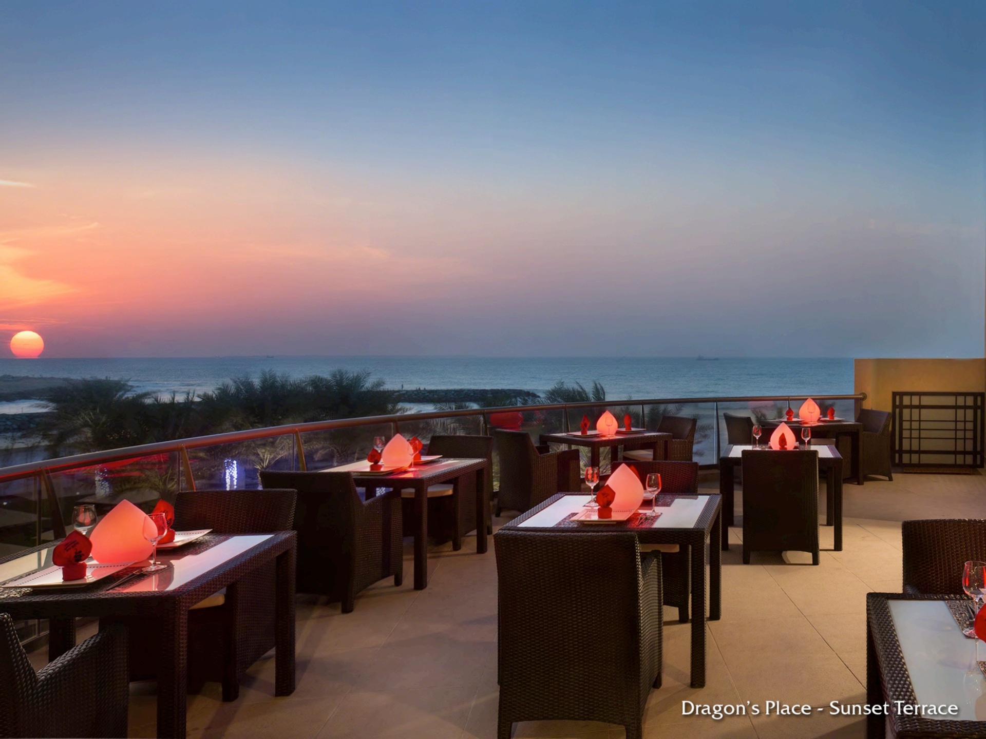
Dragon's Place - Sunset Terrace