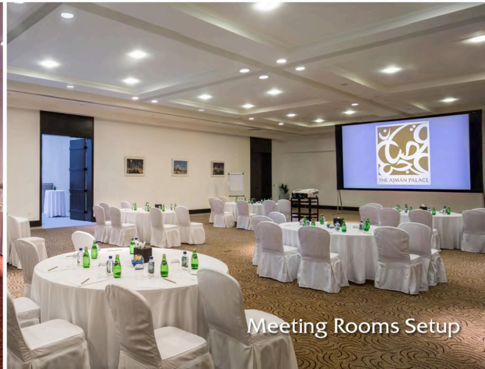
Meeting Rooms Setup