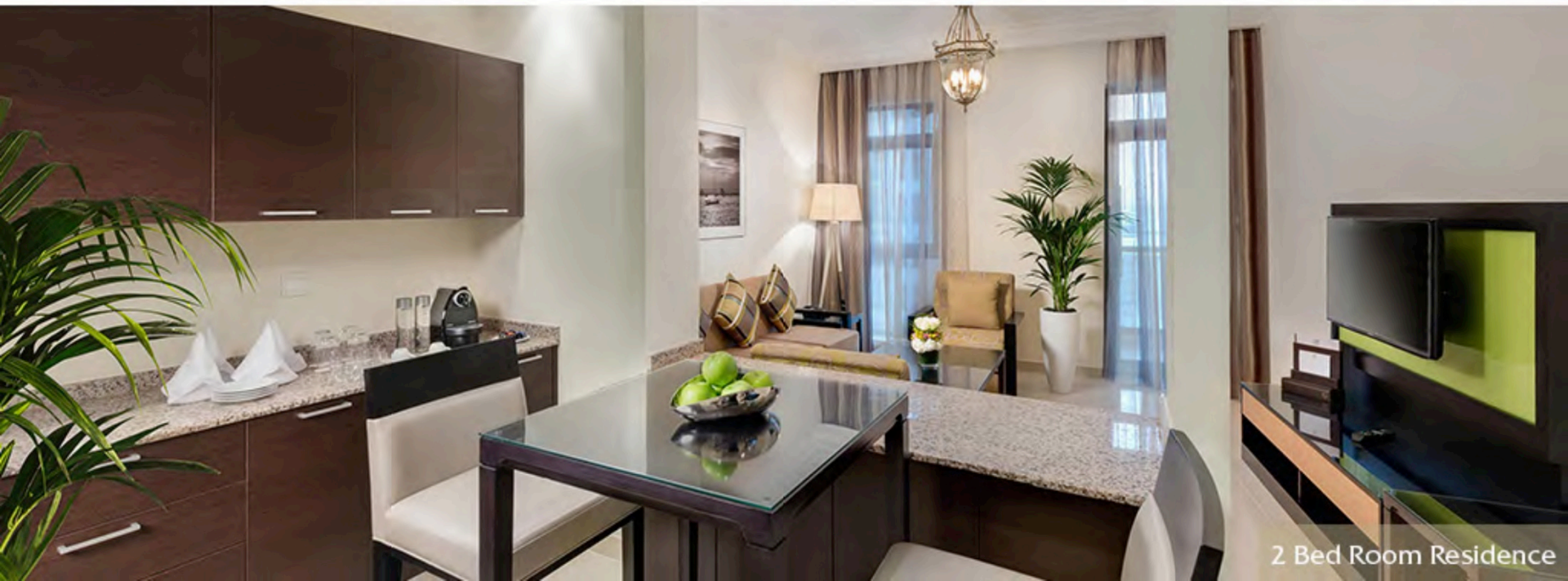
2 Bed Room Residence