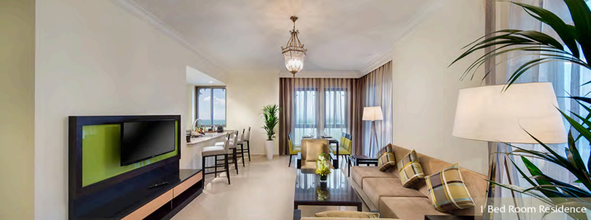
1 Bed Room Residence