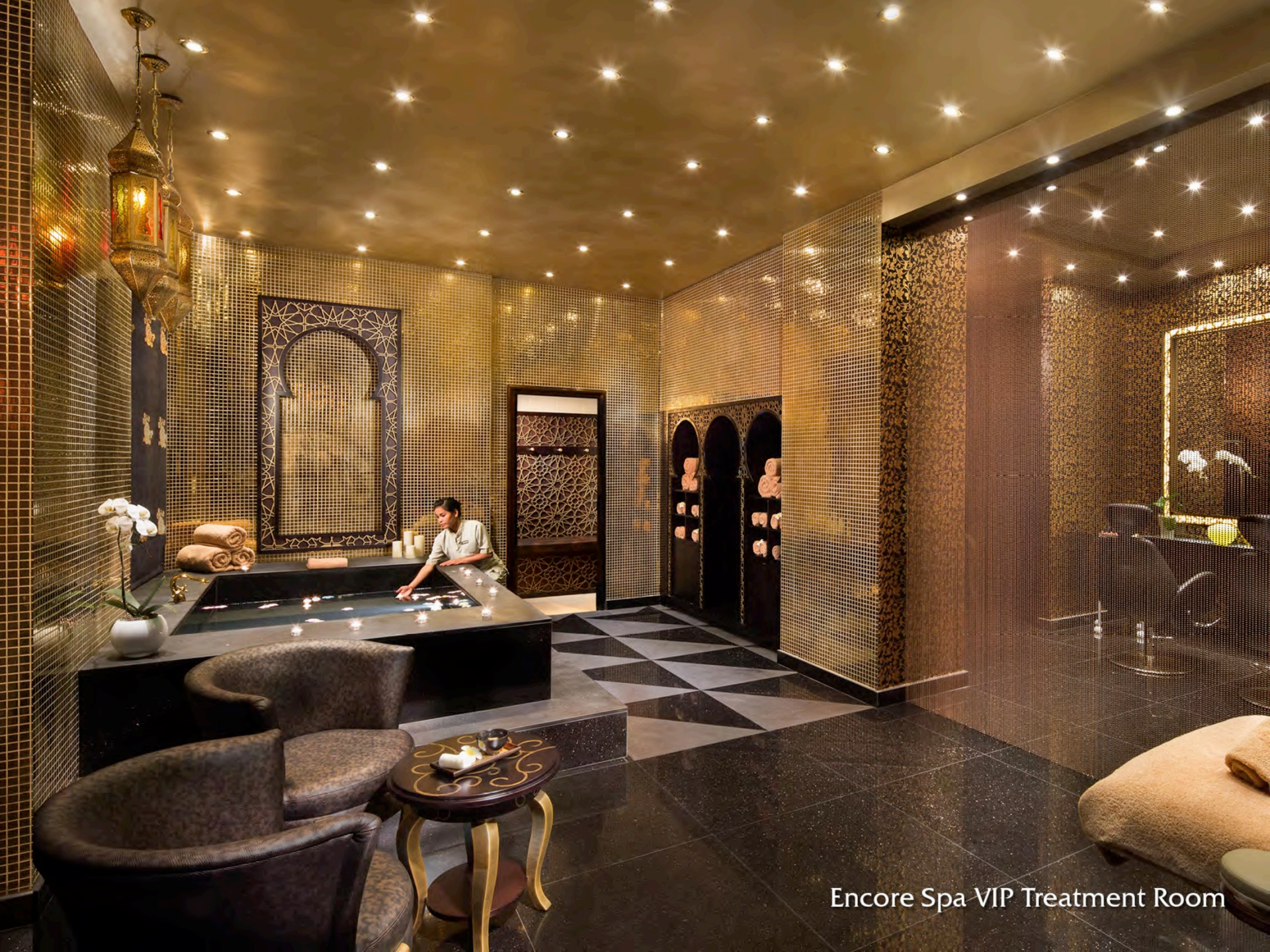
Encore Spa VIP Treatment Room